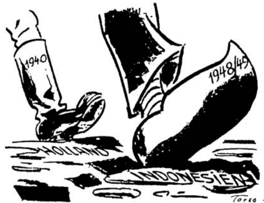
Bron 16 - 'Zweierlei Stiefel' (twee soorten laarzen).