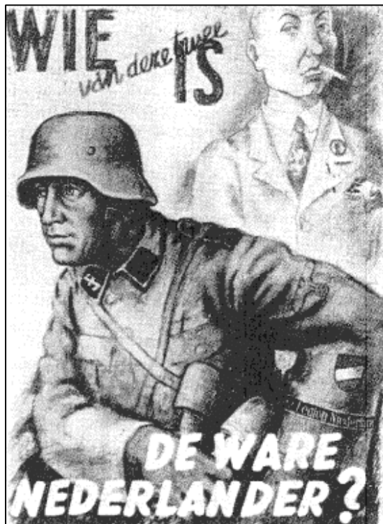
Bron 1 – Poster 'de ware Nederlander'